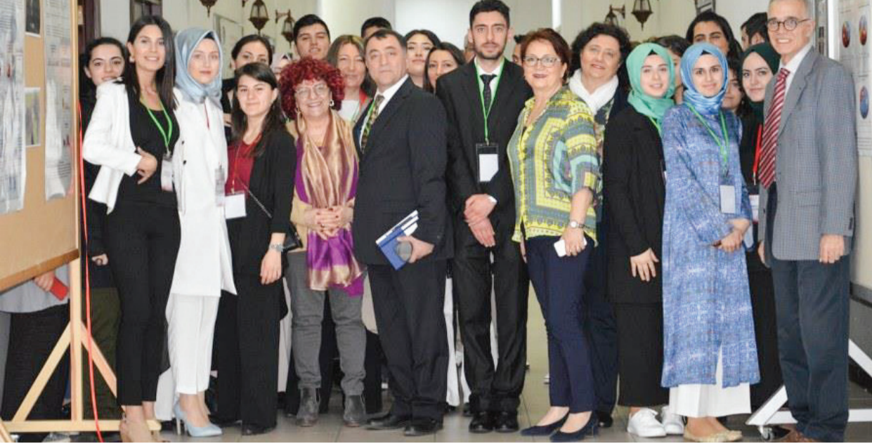
İktisadi ve İdari Bilimler Fakültesi Siyaset Bilimi ve Uluslararası İlişkiler Bölümü öğrencileri tarafından ilk kez 'Siyaset Bilimi ve Uluslararası İlişkiler Öğrenci Kongresi' gerçekleştirildi.