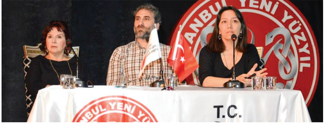
Fen-Edebiyat Fakültesi Psikoloji Bölümü, Şişli Milli Eğitim Müdürlüğü ve Şişli Rehberlik Araştırma Merkezi'nin paydaşlığında "Rehberlik Sempozyumu" düzenlendi.