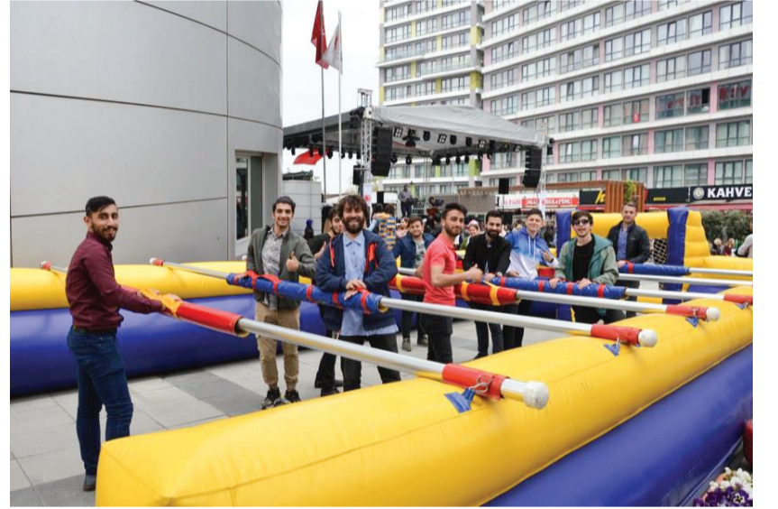
Öğrenciler etkinlik alanında Canlı Langırt oynayarak eğlenme fırsatı buldu.