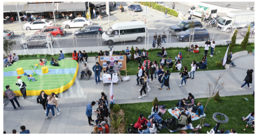
Üniversitemiz öğrencileri bahar şenliğinde sınavların yorgunluğunu üzerlerinden attılar.

öğrencilerimizin hayatın her alanından ders çıkarmasıdır. Onların burada arkadaşlarıyla birlikte olmaları, değer üretmeleri anlamına geliyor. Bizler de hocaları olarak bu değerle onlara eşlik etmekten dolayı çok mutluyuz."